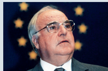
Helmut Kohl Der deutsche Bundeskanzler amtierte von 1982 bis 1998 und gilt als einer der geistigen Väter der Einheitswährung. Der Euro leidet heute unter dem nach wie vor heterogenen Staatenbund.

Die immense Schuldenkrise lässt alles Gegensteuern derzeit zur delikaten Angelegenheit werden. Dort, wo Staaten bei